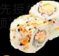
R45 15.00 CHF Saumon cuit concombre Cooked Salmon Cucumber