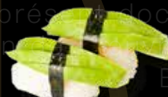
R29 5.00 CHF Avocat Avocado