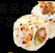
R46 15.00 CHF Crevette tempura avocat Tempura Shrimp Avocado