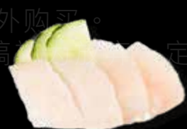
R25 12.00 CHF Daurade Sea Bream