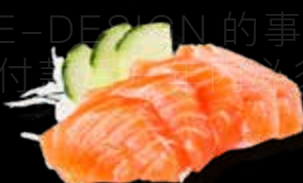
R23 12.00 CHF Saumon Salmon