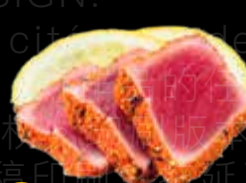
R27 18.00 CHF Thon Tuna