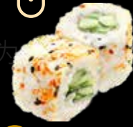
R43 13.00 CHF Veggie Veggie