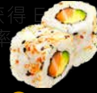
R44 15.00 CHF Saumon avocat Salmon Avocado