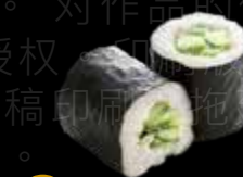
R38 6.00 CHF Concombre Cucumber