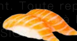
R30 7.00 CHF Saumon Salmon