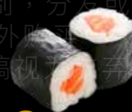
R39 9.00 CHF Saumon Salmon