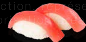
R31 9.00 CHF Thon Tuna