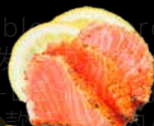
R26 15.00 CHF Saumon Salmon