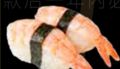
R33 7.00 CHF Crevette Shrimp