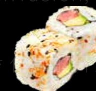
R47 16.00 CHF Thon avocat Tuna Avocado