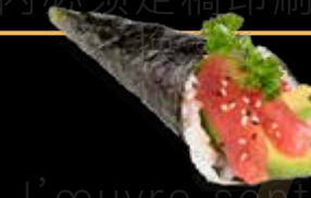
R50 10.00 CHF Thon avocat Tuna Avocado