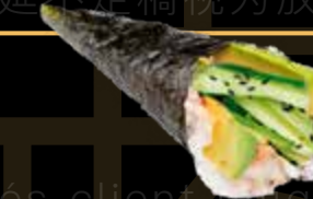
R51 8.00 CHF Veggie Veggie