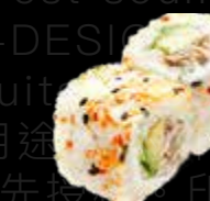
R48 16.00 CHF Thon cuit avocat Cooked Tuna Avocado