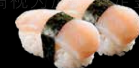
R35 10.00 CHF Noix de St. Jacques Scallop