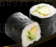
R36 7.00 CHF Avocat Avocado