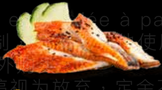
R28 18.00 CHF Anguille Eel