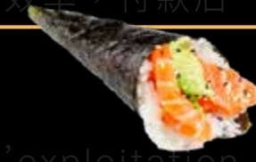
R49 9.00 CHF Saumon avocat Salmon Avocado