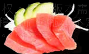
R24 16.00 CHF Thon Tuna