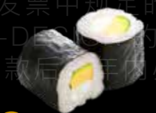
R37 8.00 CHF Cheese avocat Cheese Avocado