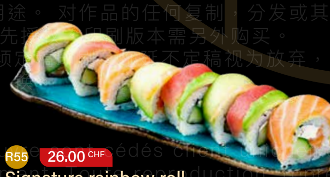
R55 26.00 CHF Signature rainbow roll California roll avec saumon, cream cheese, concombre, couvert de saumon, avocat et thon California roll with salmon, cream cheese, cucumber, topped with salmon, avocado, and tuna