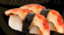
R32 9.00 CHF Anguille Eel