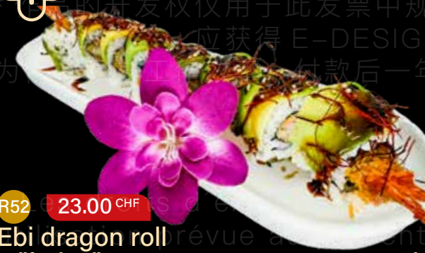
R52 23.00 CHF Ebi dragon roll California roll avec crevette tempura, avocat, sauce teriyaki, filament de piment doux et sésame California roll with tempura shrimp, avocado, teriyaki sauce, sweet chili threads and sesame