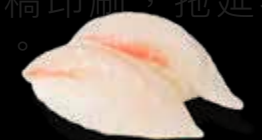
R34 7.00 CHF Daurade Sea Bream