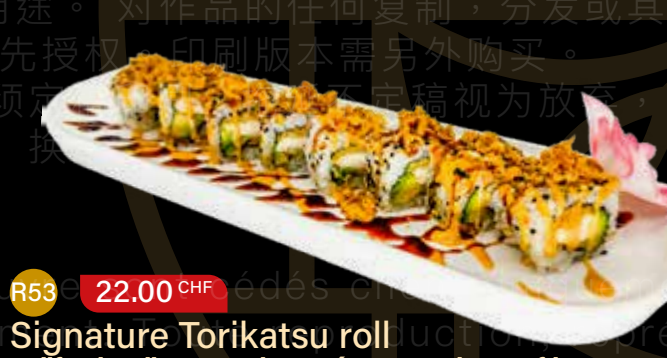
R53 22.00 CHF Signature Torikatsu roll California roll avec poulet pané, avocat, oignons frits, sauce teriyaki, sauce maison et sésame California roll with breaded chicken, avocado, fried onions, teriyaki sauce, homemade sauce, and sesame