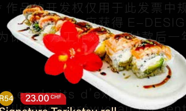
R54 23.00 CHF Signature Torikatsu roll California roll avec poulet pané, avocat, oignons frits, sauce teriyaki, sauce maison et sésame California roll with breaded chicken, avocado, fried onions, teriyaki sauce, homemade sauce, and sesame